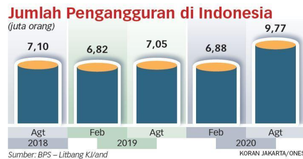
Gambar 4. Jumlah Pengangguran 2018-2020 Sumber: BPS – Litbang KI/and